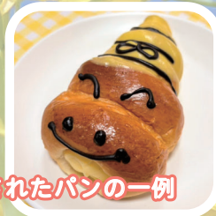
これまで商品化されたパンの一例