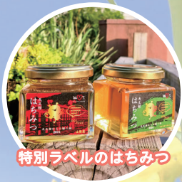
特別ラベルのはちみつ