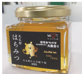
2023年度の特典のはちみつ