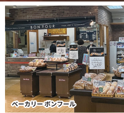
ベーカリーボンフル