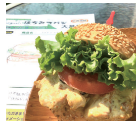
2023年度の商品化したパン