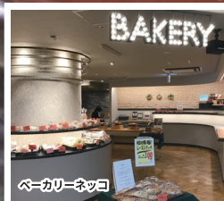
ベーカリーネッコ

マルヤガーデンズ 地階ベーカリーネッコ 山形屋(鹿児島) 2号館 地階ベーカリーボンフル